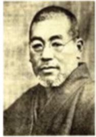
Dr. Mikao Usui

Reiki ist universelle Energie und wird in heutiger Zeit als Alternativ-Medizin oder auch als Energie-Medizin bezeichnet und unterstützt die ärztlichen Therapien bei Patienten. Sie stärkt Pflege- und Therapiepersonal und verhindert Stress- und Burn-out-Syndrom.